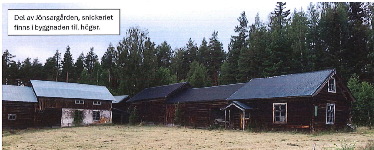
Bilder från snickeriet som stått orört i många decennier

Del av Jönsargården, snickeriet finns i byggnaden till höger.